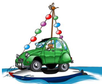
Grafik: Dominik Borchers